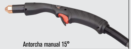
Antorcha manual 15°