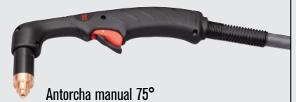
Antorcha manual 75°

(visitar www.hypertherm.com para más opciones de antorchas)