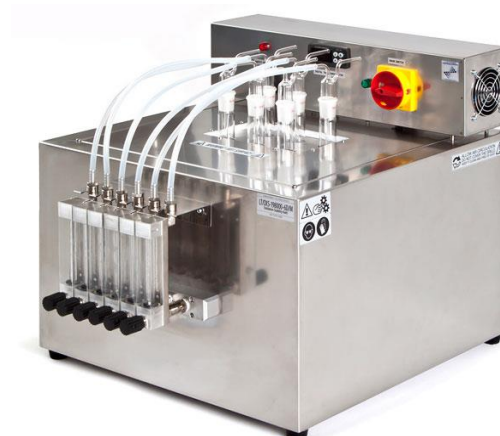
شکل ۲- نمونه ای از دستگاه انجام تست پایداری اکسیداسیون

وجود مواد افزودنی در مشخصات فنی روغن عایقی برای ترانسفورماتورهای توزیع ممنوع گردیده است.